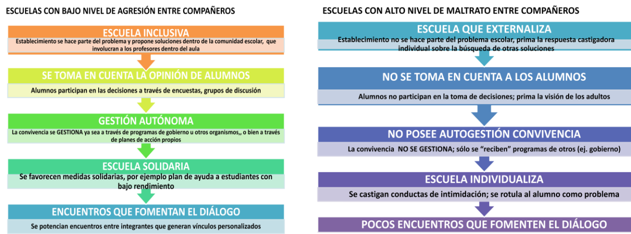
Figura 4. Diferencias en la gestión de la convivencia entre escuelas con alto y bajo nivel de agresión entre pares.

Similares resultados han emergido de dos tesis de pregrado que se llevaron a cabo en el marco del proyecto Fondecyt. En una de estas tesis (Rodríguez, 2010) dividimos a los colegios entre aquellos con altos niveles de agresión y aquellos con bajos niveles de agresión, y luego analizamos cómo diseñaban y organizaban sus sistemas de convivencia en cada tipo de establecimiento. Encontramos que habían diferencias entre las escuelas con alto y bajo nivel de agresión. Mientras que en las escuelas con altos niveles de agresión, las acciones tendían a ser más estrictas y castigadoras, en las escuelas con bajos niveles de agresión las acciones que llevaban a cabo los equipos de gestión y los profesores tendían a ser más conciliadoras e incluían el diálogo entre profesores y alumnos dentro de la sala de clases.